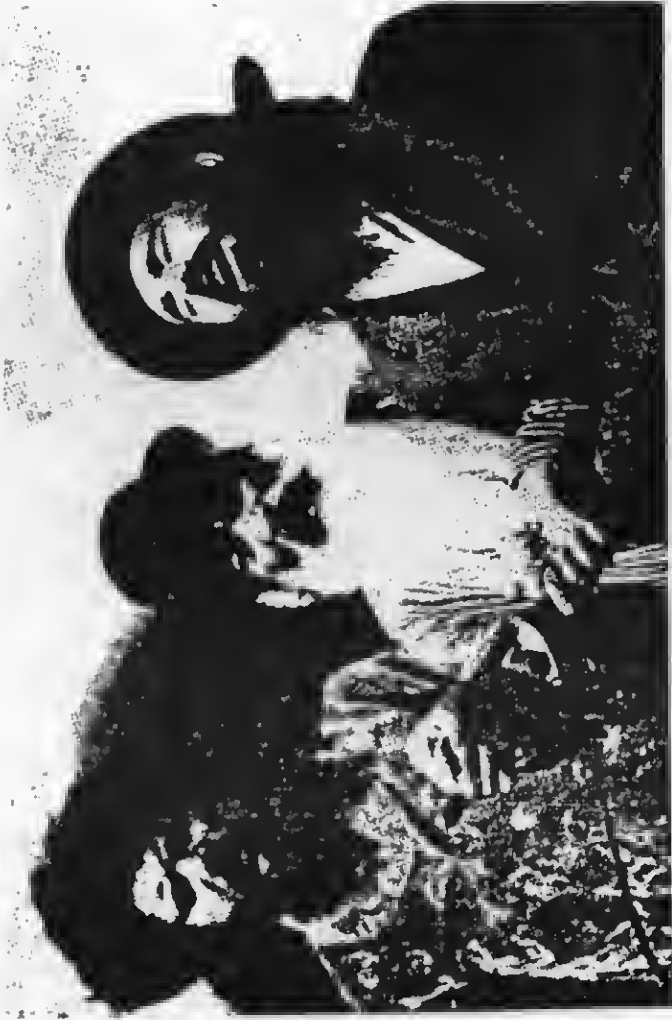
Tipos clásicos de judeus talmudistas fanáticos.